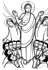
Apóstols de Jesucristo