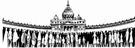
Sentir sobre nosotras el peso de la Iglesia